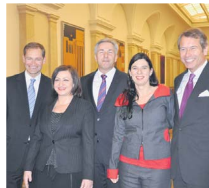
Vorstellung der neuen Senatorinnen und Senatoren im SPD-Landesvorstand und der Fraktion.

ne deutliche Mehrheit für den Vertrag aus. „Wir haben für Bündnisse jenseits der CDU gekämpft“, so Müller. „Wir alle wollten etwas anderes.“ Die SPD habe sehr ernsthaft mit den Grünen verhandelt, aber erkennen müssen, dass es nicht geht. Die Grünen seien derzeit nicht regierungsfähig. Müller: „Wir sind nicht für ein Koalitionsabenteuer gewählt worden, wir sind gewählt worden, um Probleme zu lösen.“