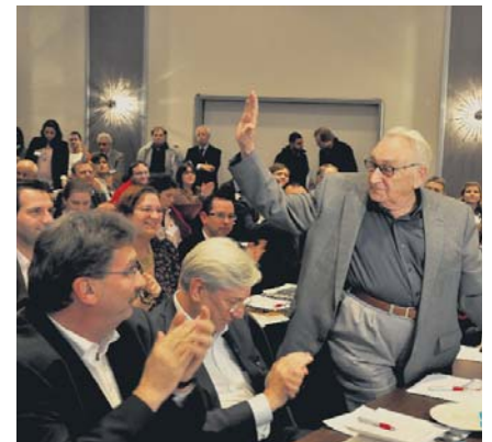
Ehrengast auf dem Parteitag der Berliner SPD: Egon Bahr verfolgte die Debatte um den Koalitionsvertrag.

ren Öffentlichen Beschäftigungssektor (ÖBS) verabschiedet. Wir setzen auf ein Programm „BerlinArbeit“, in dessen Rahmen es auch weiterhin öffentlich geförderte Beschäftigung geben wird, um insbesondere Langzeitarbeitslose und gering Qualifizierte in Arbeit zu bringen. Dazu gehören auch eine Qualifizierungsoffensive und eine vertiefte Berufsorientierung und Berufseinstiegsbegleitung. Besonders wichtig ist die Einigung auf eine Erhöhung des Mindestlohns im Berliner Vergabegesetz auf 8,50 Euro.