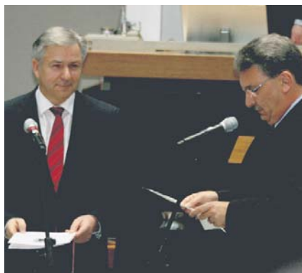
Vereidigung: Klaus Wowereit ist am 24. November erneut zum Regierenden Bürgermeister gewählt worden.

Auf dem Landesparteitag der Berliner SPD am 21. November sprach sich ei-