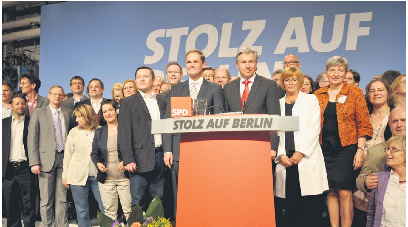
Klaus Wowereit, Michael Müller und die Kandidatinnen und Kandidaten der Berliner SPD: Mit Geschlossenheit in die Wahlauseinandersetzung.

Foto-Community. Bildberichte von spannenden Aktionen können direkt auf die Internetseite der Berliner SPD geladen werden. Unter fotos.spd-berlin.de sind für jeden Bezirk dafür eigene Formulare eingerichtet.