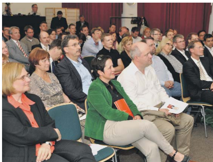
Ideenaustausch zum Wahlkampfbeginn: Der Konvent der Kandidatinnen und Kandidaten in der „Alten Feuerwache“.

Die besondere Verbindung zwischen Sozialdemokratie und Hauptstadt soll auch im Wahlkampf betont werden. „Die SPD ist die Berlin-Partei und Klaus Wo-