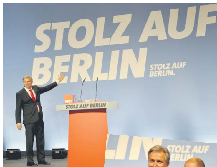
Stolz auf Berlin, Unterstützung aus Hamburg: Olaf Scholz stärkte der Berliner SPD den Rücken.

Die Berliner SPD mache keinen Wahlkampf gegen andere Parteien, sondern für ihr Ziel der sozialen Gerechtigkeit für alle, betonte Wowereit.